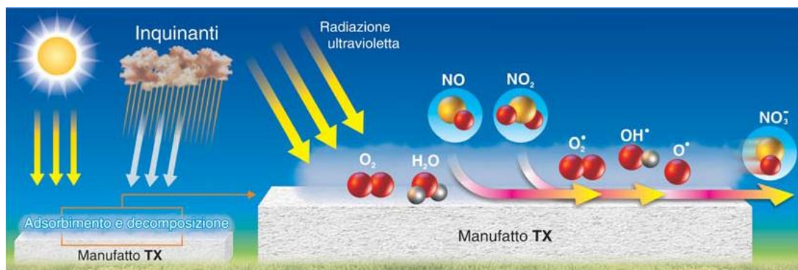
Figure 1 : schema di funzionamento del principio attivo TX Active